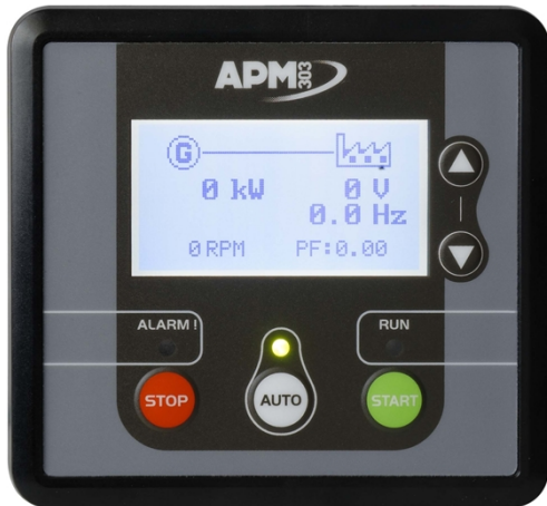
APM303, Einfache Bedienung

APM303 ist ein Multifunktionsgerät sowohl für den manuellen als auch den Automatikbetrieb. Mit einem LCD-Bildschirm und besonders benutzerfreundlicher Bedienung bietet dieses Gerät Grundfunktionen hoher Qualität für die einfache und zuverlässige Bedienung Ihres Stromerzeugers einschließlich der Möglichkeit, die Anlage zu überwachen. Es bietet folgende Funktionen: